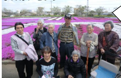
ふれあいセンター