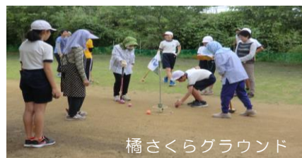
橘さくらグラウンド

環境美化活動、読み聞かせ・傾聴、食事サービス調理 防犯パトロール、施設等行事支援・交流、施設利用者介助 など