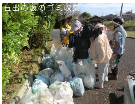
石出の坂のゴミ収集