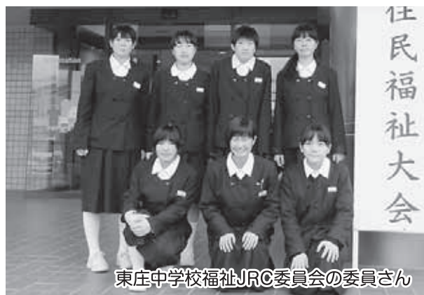
東庄中学校福祉JRC委員会の委員さん

学校での福祉活動発表と歯止めのかからない「あなた(高齢者)を狙う詐欺にご用心」として実際の手口(マイナンバー制度を悪用)を紹介したり、また、うさぎとかめの替え歌で「もしもしじいちゃんばあちゃんよ～」とみんなで合唱し、「被害に遭わないように気をつけて！」と熱く呼びかけました。