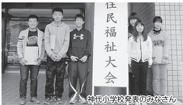
神代小学校発表のみなさん

神代小学校児童6名は「地域と交流～明るいまちづくり～」を発表。地域の高齢者の方々と花植え・グラウンドゴルフ大会の交流や東庄デイサービスを訪問した時の様子を発表しました。会場のみなさんとの交流タイムでは、脳トレーニングや笑点のテーマソングにあわせての簡単なリズム運動を披露。椅子に座って簡単にできるので、「レッツ スタート！」のかけ声とともに、会場内は大変盛り上がりました。