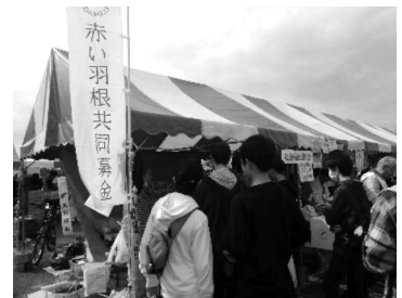
令和元年ふれあいまつりでの募金活動の様子

手話教室、社協広報紙発行(2回)、住民福祉大会、ふれあいまつり、福祉教育推進校助成(2校)、民児協助成、HP・助成車両維持費