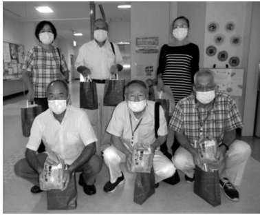
社協事務所から見守り活動行ってきま～す。

コロナ禍でボランティアによる調理が難しい中、9月はお弁当ではなく「東庄産コシヒカリ」を食事サービス対象者へ担当民生委員が「健康状態の確認や何か変化があった場合は、遠慮なく連絡するように」と見守り活動を兼ねてお届けしました。あわせて東庄町陶遊会から寄贈の「両とって付マグカップ」を渡しました。新米を受け取った対象者からは、「こんなに早く新米をいただいて、とってもうれしいです。また、こんなすてきなカップもいただき、ありがとうございます。」と喜んでいました。