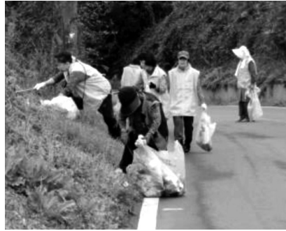
多くのゴミが捨てられている「石出坂」のゴミ拾い

また、自宅周辺などで、できる範囲のゴミ拾い等のご協力をお願いいたします。その際、集めたゴミは、マナーを守って分別し、家庭ごみとして一緒に出してください。