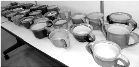
「東庄町陶遊会」結成10周年記念として食事サービスの方へと同じ色・形が一つないカップ50個をいただきました。