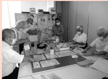
袋詰め作業の様子

橋地区の80歳以上ひとり暮らし世帯等へ見守り活動として「新米コシヒカリ」を届けました。今年度から、地域の見守り活動にも重点をおき、きめ細やかな福祉サービスをお届けできるよう、皆で検討しながら活動を進めています。