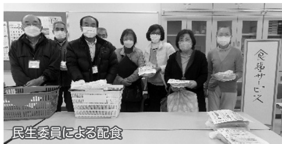
民生委員による配食