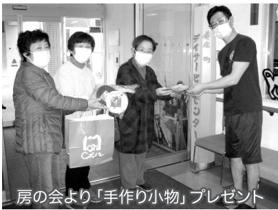
房の会より「手作り小物」プレゼント

東庄町ボランティア連絡協議会はボランティアに興味のある方、ボランティアをやってみたいがきっかけがないと思っている方へのご支援を致します。気軽にご相談ください。