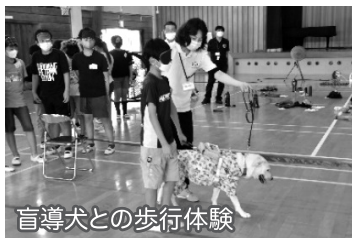
盲導犬との歩行体験