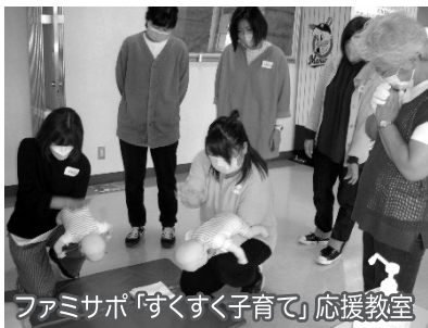
ファミサポ「すくすく子育て」応援教室