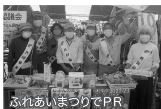
ふれあいまつりでPR