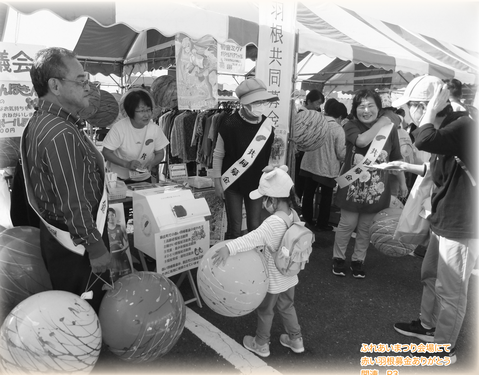
ふれあいまつり会場にて 赤い羽根共同募金ありがとう 関連 P3