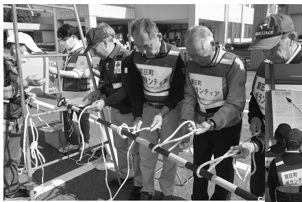
ロープワーク 巻き結び・もやえ結びなど