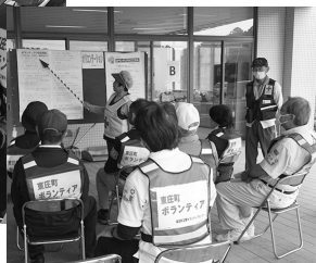
オリエンテーションでの説明

10月28日(土) オーシャンプラザを会場に、千葉県東方沖を震源とする大地震の想定で災害ボランティアセンターの立ち上げを町から依頼され、ボランティアを派遣するまでの一連の流れを行いました。事前登録ボランティアの方にも参加していただき総勢63名の参加となりました。それぞれのブースにて役割を確認し、本番に備えた訓練となりました。