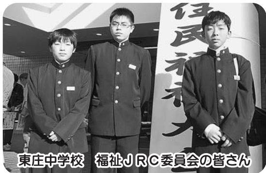
東庄中学校 福祉JRC委員会の皆さん

各学年ごとに行っている取り組みでは、高齢者や幼稚園児との交流・福祉施設への訪問。学校全体での活動は、学校周囲の美化活動・アルミ缶の収集・一円玉募金などを発表してくれました。