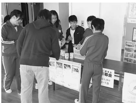
毎年、神代小学校さわやか委員会では、赤い 羽根募金を呼びかけ募金活動を行っています

歳末たすけあい募金は、地域で福祉を必要とする人たちが、安心して暮らすことのできるよう援助するための募金です。