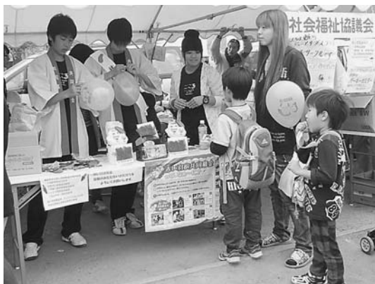
11月3日東庄ふれあいまつりにて 杉の子サークルの皆さんが募金活動に協力