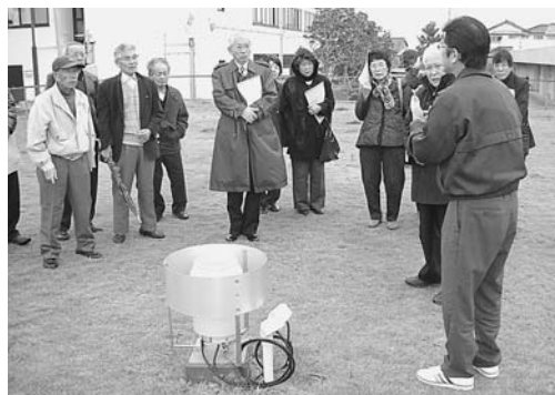
強風の中、气象台職員より屋外にある観測機器の説明を受ける。

今回の研修内容は、防災ボランティア活動に有効な情報や日頃から災害に対する備え等について理解を深めることができ大変参考になったと皆さん喜んでいました。