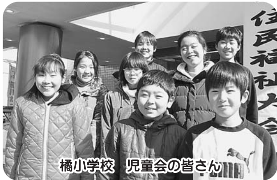
橋小学校 児童会の皆さん

町社会福祉協議会の福祉教育推進指定校となっている橋小学校と東庄中学校。そして、赤十字防災ボランティア東庄町地区協議会の皆さんから、福祉活動の体験を発表していただきました。