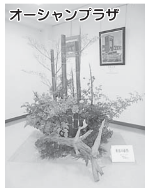
オーシャンプラザ