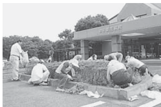
←植え込みの草とりを実施中!

5月25日(金)「第26回地域医療現地研修会」が、東庄町を会場に行われました。この研修会は、全国各地の国保病院関係者が集まり、地域医療の現場を視察する研修会です。大勢の来場者が、東庄町を訪れるということで、普段に増して各ボランティアの皆さんが、力を合わせて協力をしてくれました。式典会場となる町公民館や視察会場の東庄病院・オーシャンプラザ・保健福祉総合センターにプランタを飾り、視察会場周囲の草取りなどを行い、きれいに来場者を迎えることができました。ボランティアの皆さんは、「よろこんでくれるといいね。」と話しながら和気あいあいと作業を行いました。