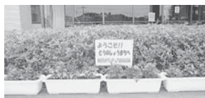
←「きれいなお花でお出迎え」することができました

平成24年4月1日に現在の登録状況 グループ数 41グループ 826人 個人 21人 総計 847人