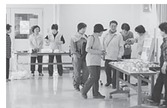
駅からハイキングに協力