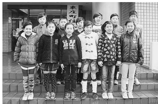
笹川小学校のみなさん

笹川小4年生12名の児童は、高齢者施設訪問での活動の様子や学校での交流会の様子を実演や映像をとおして伝えてくれました。東庄中学校は、福祉JRC委員会の生徒が、学校で取り組んでいる福祉活動や自分たちが体験をしたトレーニングセンターへ参加した様子の感想を発表してくれました。