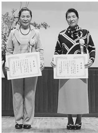
左) 花園流真秀会、右) 真訪会