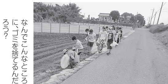
なんでこんなところ に、ゴミを捨てるんだ らう？

平成26年6月25日（水）自分たちが歩く通学路をきれいにしようと、東城小学校全校児童によるゴミ拾いが行われました。登校班に分かれ帰り道、袋を片手に持ちながら落ちているゴミを見つけ、ビン・カン、燃えるゴミを分別しながら拾いました。東城小学校では、年に2回ほど全校児童が清掃活動に取り組んでいます。