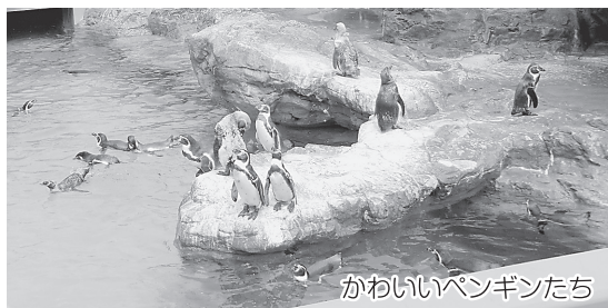
かわいいペンギンたち

ひとり親世帯でレクリエーションに参加したい場合は、地域のひとり親家庭福祉推進員か社会福祉協議会までご連絡下さい。