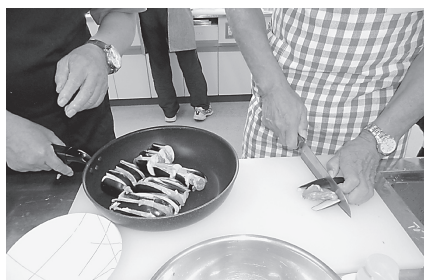
あっ切ったらすれ ちゃった！ はさみ直せば大丈 夫

この料理教室は、管理栄養士を講師に栄養指導と男性でもバランスの良い食事を簡単に調理できいざという時に役立ててもらおうこと、参加者との仲間づくりを目的に行っています。包丁を持たない方大歓迎です。参加してみませんか。申し込みは、社会福祉協議会まで。次回は、12月を予定しています。